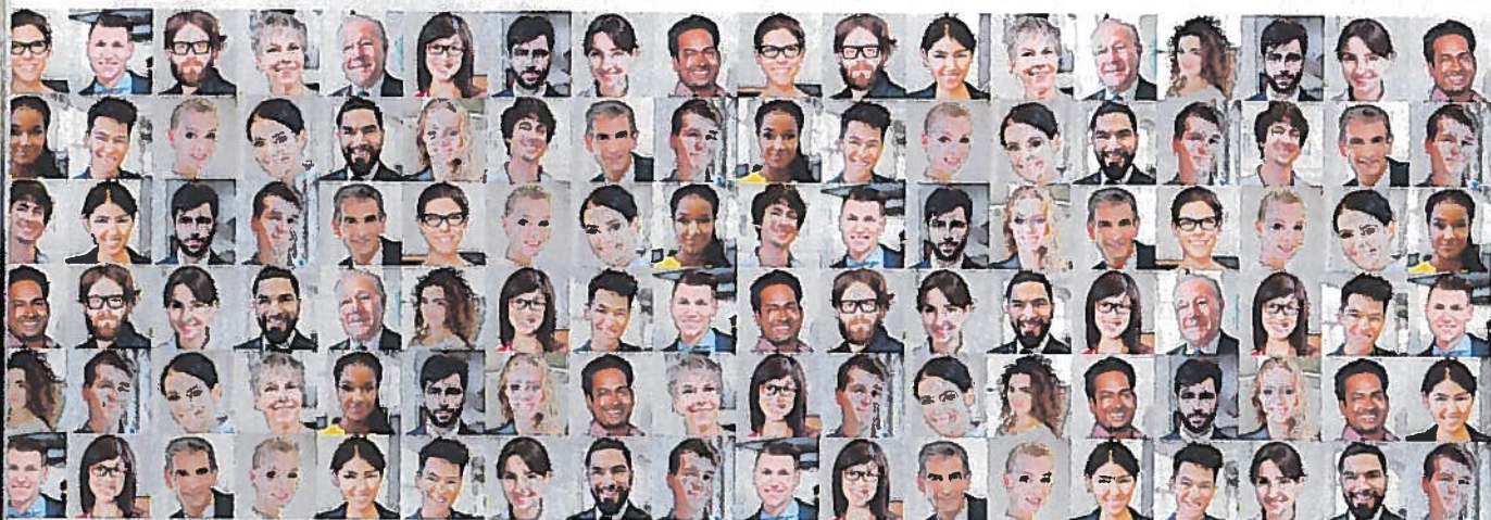
L'entreprise familiale est multiple, de tailles et de structures variées.

LES ENTREPRISES FAMILIALES SE CARACTÉRISENT GÉNÉRALEMENT PAR UNE VISION À LONG TERME, UN PROCESSUS DÉCISIONNEL RAPIDE ET DES VALEURS FORTES ET PARTAGÉES. LA FAMILLE CONSTITUE UN ACTIONNAIRE DE RÉFÉRENCE VOIRE LE SEUL ACTIONNAIRE DE L'ENTREPRISE. DES MEMBRES DE LA FAMILLE PARTICIPENT AU MANAGEMENT ET À DES POSTES OPÉRATIONNELS CLEF. LA TRANSMISSION À L'UN DES MEMBRES DE LA FAMILLE EST SOUVENT PRIVILÉGIÉE. ELLE PEUT ÊTRE DE PREMIÈRE GÉNÉRATION (ÈRE DU FONDATEUR), DE DEUXIÈME GÉNÉRATION (ÈRE DES FRATRIES) OU DE TROISIÈME GÉNÉRATION (ÈRE DES COUSINS).