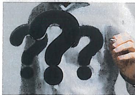
Plusieurs problématiques se posent en termes de transmission.

est importante plus elle devient significative dans le patrimoine familial.