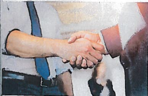
L'accompagnement de la transmission de l'entreprise familiale s'effectue dans une approche pluridisciplinaire adaptée à chaque entreprise.

Quelles sont les valeurs fondamentales de la famille, quelles sont les attentes de la famille par rapport à l'entreprise familiale ? Quelle est la culture de l'entreprise, son histoire, d'où vient-elle, quelles valeurs de la famille incarne-t-elle ? Quelle est la volonté du fondateur pour sa famille : transmettre à une seule per-