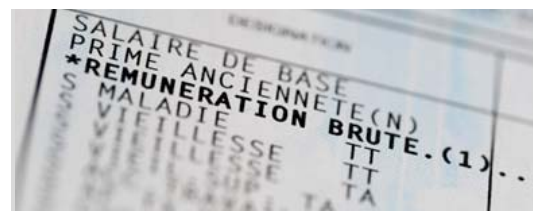
L'obligation de simplification du bulletin de paie s'appliquait déjà aux entreprises de plus de 300 salariés depuis janvier 2017. Elle est désormais étendue à l'ensemble des sociétés.

Une réforme que certains trouveront cosmétique et pas toujours facile à mettre en œuvre : en effet, si la présentation est améliorée, les calculs restent eux inchangés. Pour les entreprises qui réalisent elles-mêmes leurs fiches de paie, la première